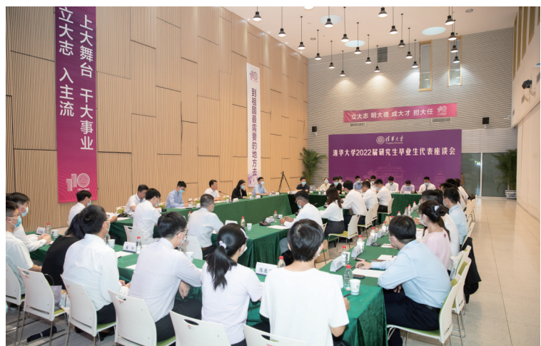
2022届研究生毕业生代表座谈会现场。