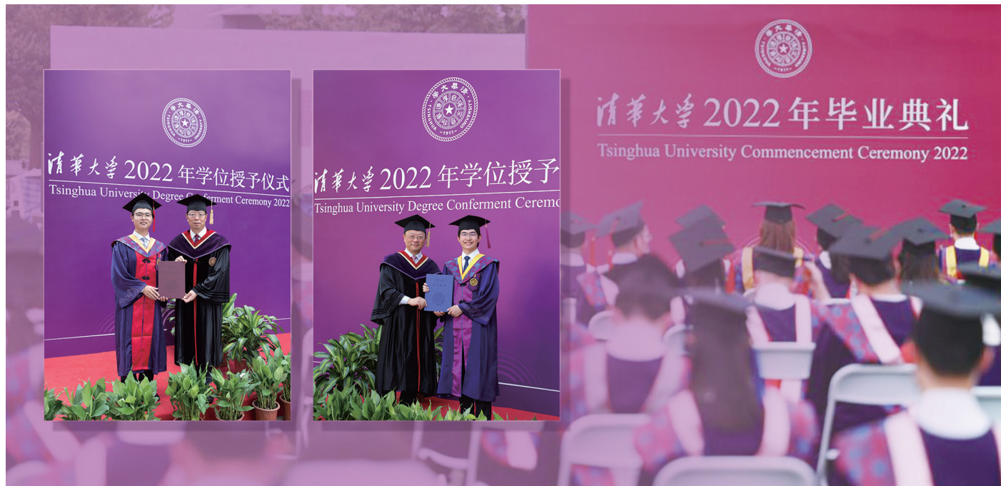
校党委书记邱勇(左图右一)、校长王希勤(右图左一)为毕业同学颁发学位证书。