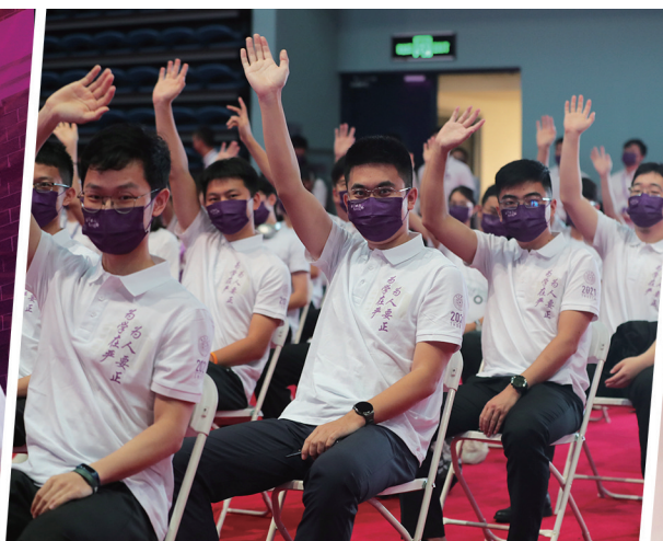
新生们在这里启航。