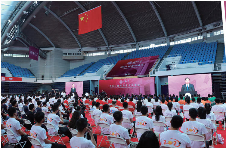
本科生开学典礼现场。