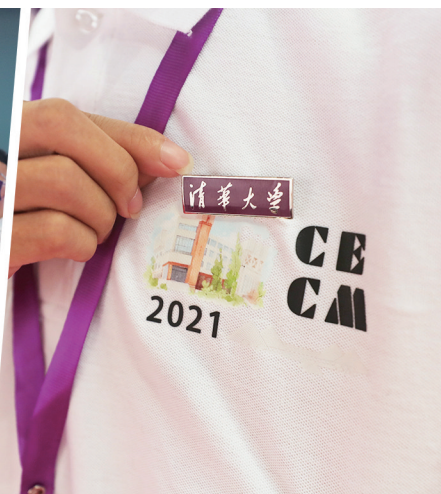
佩戴清华大学徽章。