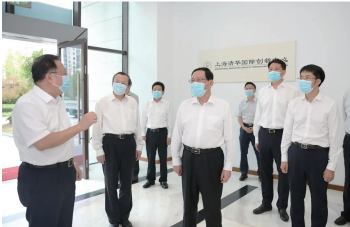
李强调研上海清华国际创新中心。

本报讯 9月2日下午,上海市委书记李强调研上海清华国际创新中心(简称“中心”)等部门在沪科研机构。上海市领导诸葛宇杰、朱芝松,清华大学副校长曾嵘参加调研。