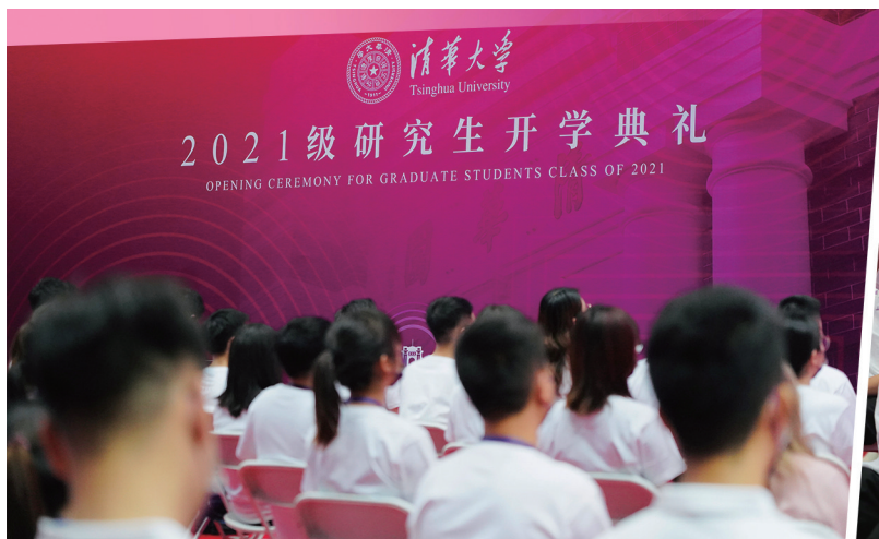
研究生开学典礼现场。