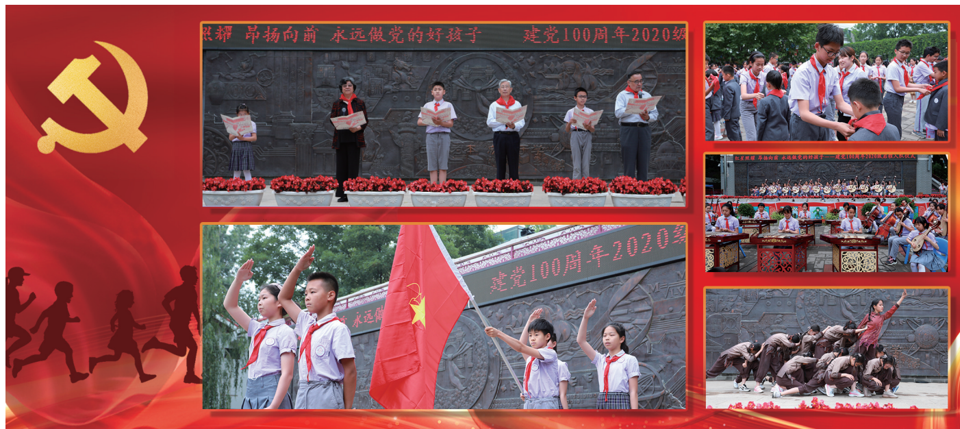
5月31日上午,清华附小在人文科学广场举行“永远做党的好孩子”2020级启程入队仪式,以精彩丰富的环节庆祝儿童节,献礼建党100周年。清华大学关心下一代工作委员会主任韩景阳、副主任张再兴,清华大学校务委员会副主任谢维和,清华大学党史学习教育第十联络指导组组长邓景康等出席活动。 文字/詹萌 图片设计/顾经纬

培养和创新创业的重要使命,要深入贯彻落实习近平总书记对研究生教育的重要指示和全国研究生教育会议精神,不断完善高层次人才培养体系,探索建立多元的博士生培养机制,通过改革推动研究生培养质量迈上新台阶。要重视美育的渗透与融合,积极培育学生欣赏美和创造美的能力,在强化(下转第7版)