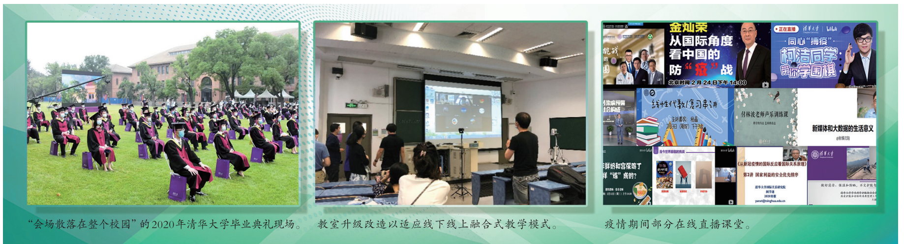
“会场散落在整个校园”的2020年清华大学毕业典礼现场。