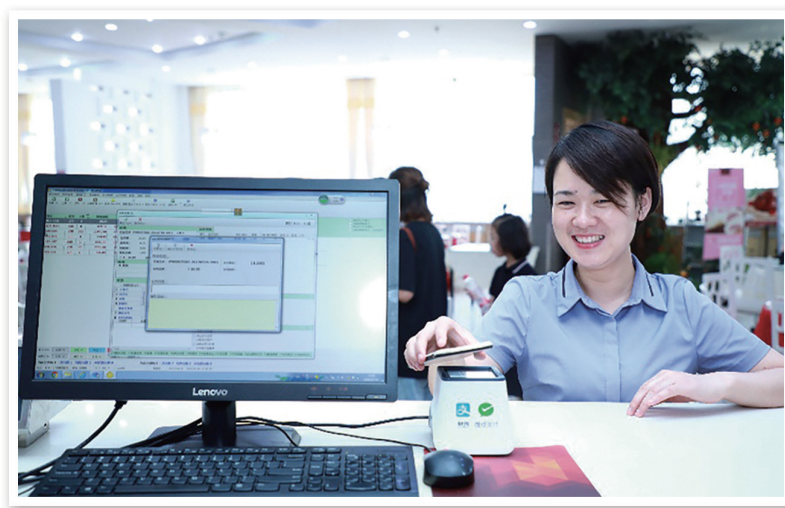
餐厅电子支付现场。

为深入推进党史学习教育,切实把学习成效转化为工作动力和实实在在的果,后勤各单位将党史学习教育同总结经验、观照现实、推动工作结合起来,开展了一场场生动的“我为群众办实事”实践活动,一件件关乎师生生活的“急难愁盼”事得到解决。