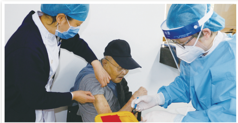
医护人员为高龄老人接种疫苗。

“我们都八九十岁了,如果你们不来社区注射,我们走不动可能只能选择不打疫苗了。特别感谢校医院来社区为我们注射疫苗。”一位耄耋之年的退休职工对校医院的医护人员说。