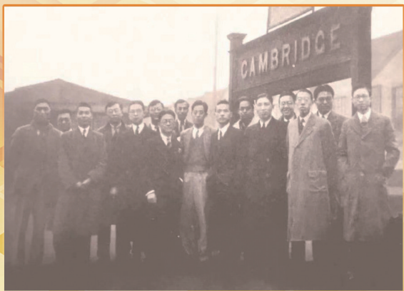
华罗庚(左六)与在剑桥学习的清华学生合影。