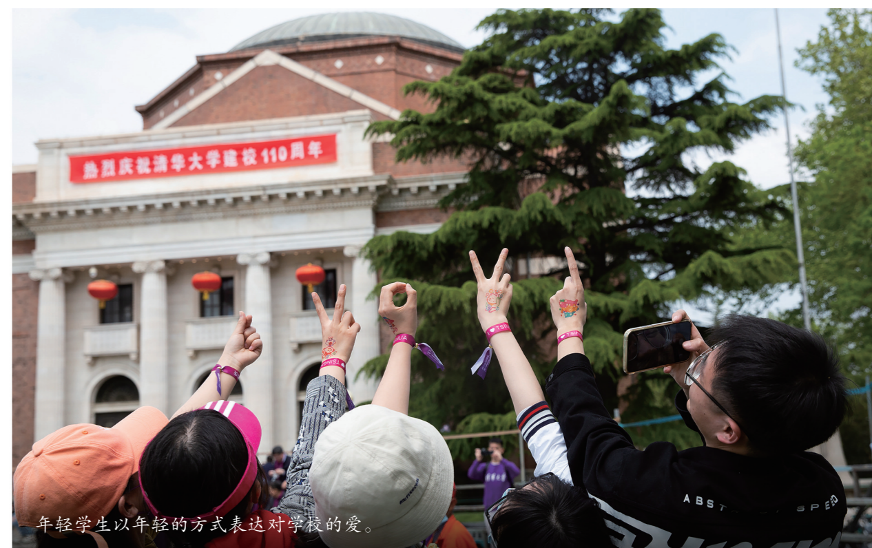
年轻学生以年轻的方式表达对学校的爱。