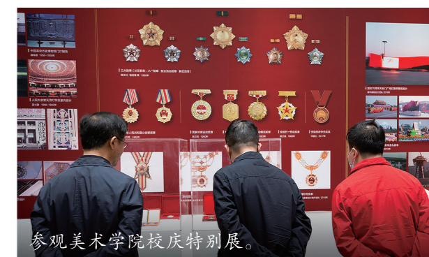
参观美术学院校庆特别展。