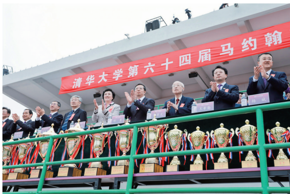
校领导、老领导出席开幕式。