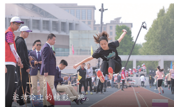
运动会上的精彩一跳。