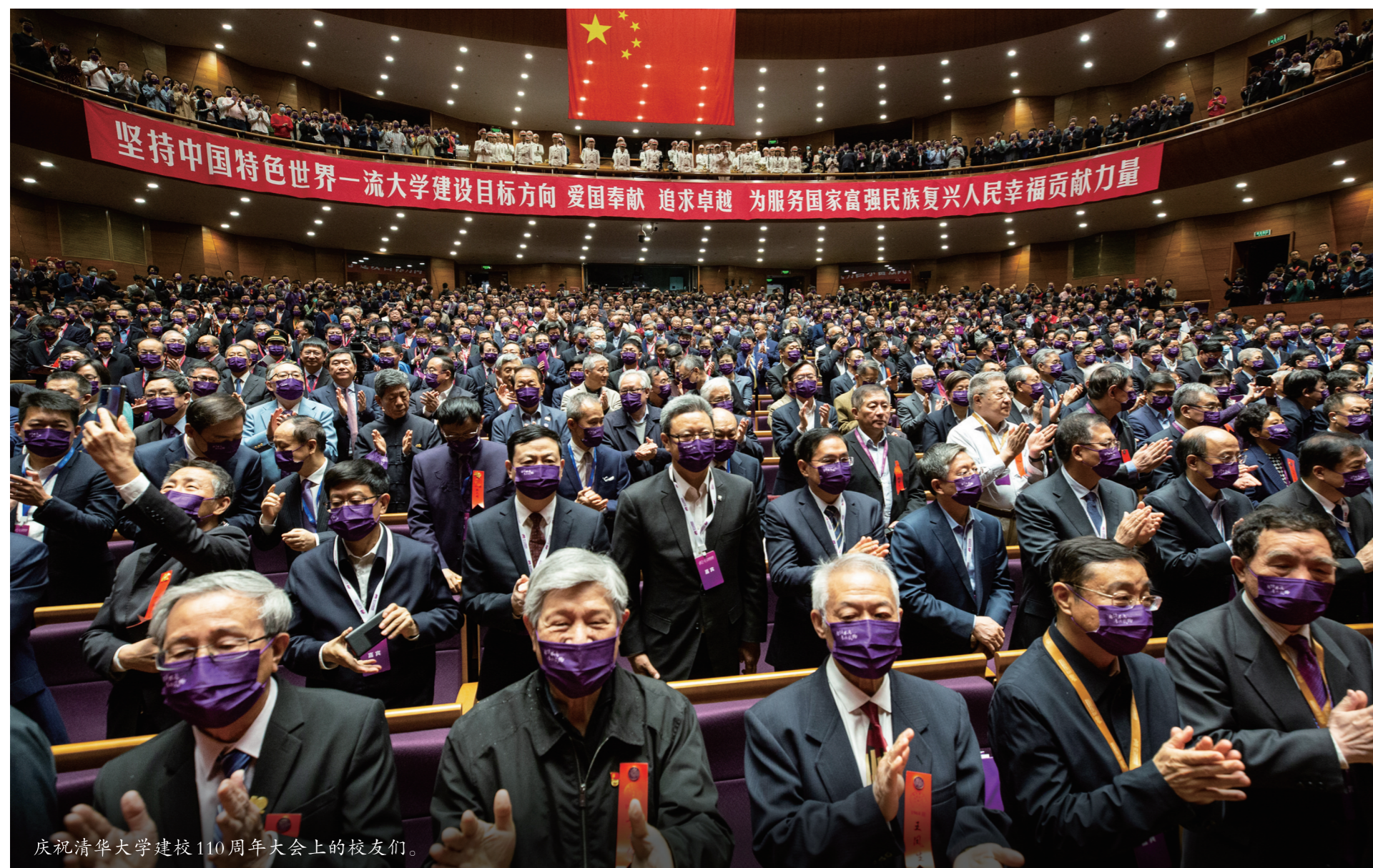
庆祝清华大学建校110周年大会上的校友们。