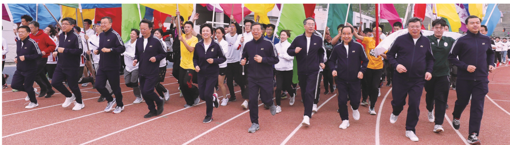
●记者 李晨晖 通讯员 樊攀