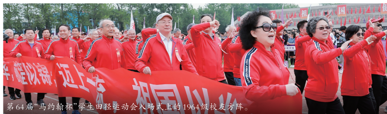
第64届“马约翰杯”学生田径运动会入场式上的1964级校友方阵。