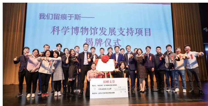
捐赠科学博物馆发展支持项目揭牌仪式现场。