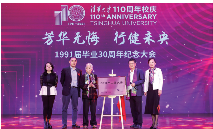
“86清华工匠大赛”启动。