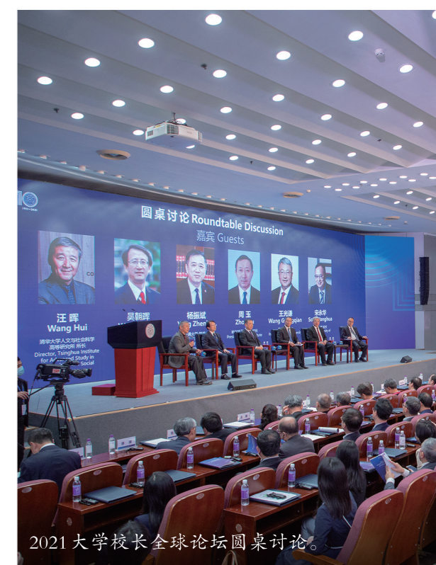
2021大学校长全球论坛圆桌讨论。