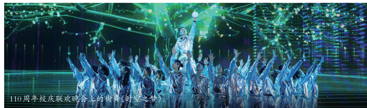
110周年校庆联欢晚会上的街舞《时空之梦》