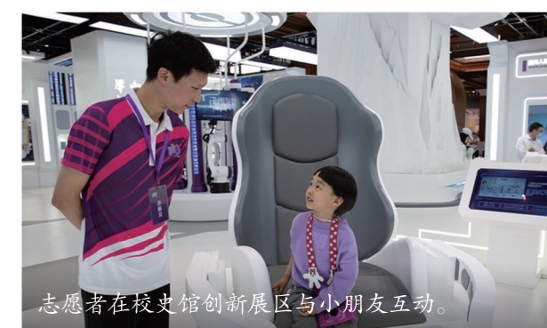
志愿者在校史馆创新展区与小朋友互动。