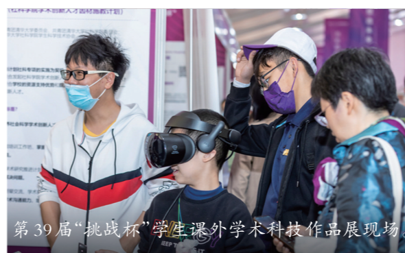
第39届“挑战杯”学生课外学术科技作品展现场。