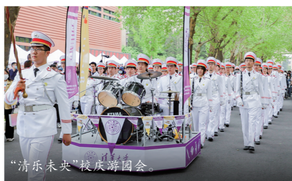
“清乐未央”校庆游园会。