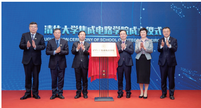
与会嘉宾为学院揭牌。