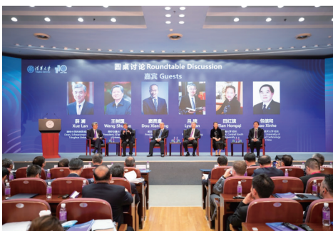
“更融合、更有韧性的大学”圆桌讨论。