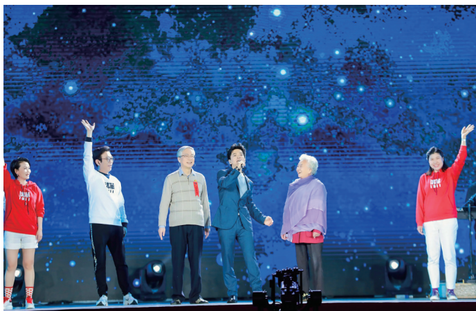
李健与校友代表共同演绎歌曲《一路花香一路唱》。