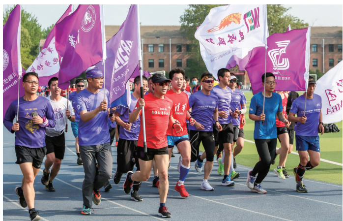
迈开步伐,努力奔跑。

本报讯(学生记者 徐亦鸣)运动点燃激情,奔跑献礼校庆。4月24日上午7时许,随着一声发令枪响,清华大学党委书记陈旭、副校长杨斌与师生校友们齐声高呼“清华1911”的口号,迈开步伐,接力奔跑110圈,为清华110周岁献上生日祝福。