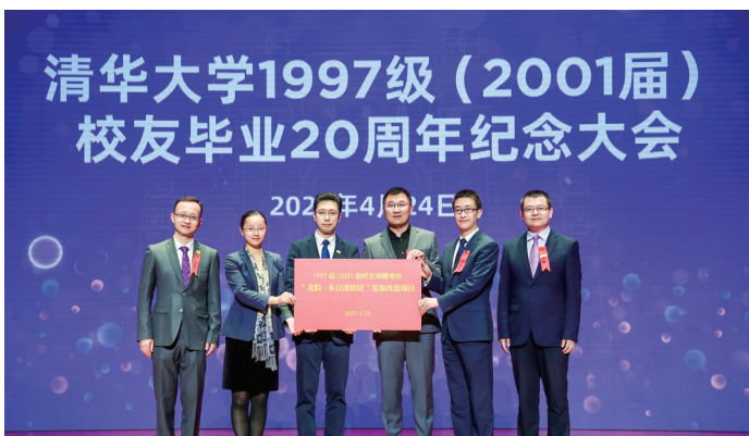
1997级校友为学校捐赠“北院16号”改造项目。