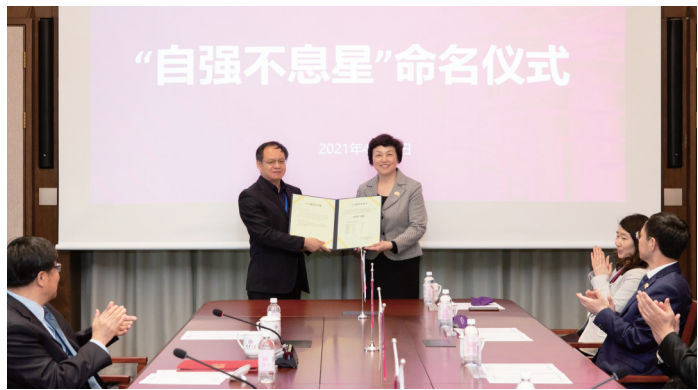
汪洪岩向清华大学颁授“自强不息星”命名公报、命名证书。

本报讯 4月23日上午,“自强不息星”命名仪式在清华大学丙所举行。中国科学院国家天文台党委书记、副台长汪洪岩,中国科学院国家天文台巡天观测和三十米望远镜研发研究组首席研究员、原副台长薛随建,清华大学党委书记陈旭、党委副书记向波涛出席。仪式由清华大学天文系主任毛淑德主持。