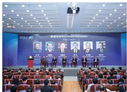
“更开放的大学”圆桌讨论。